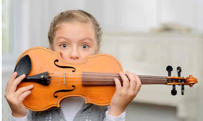
Streicherklassen am Cato ...