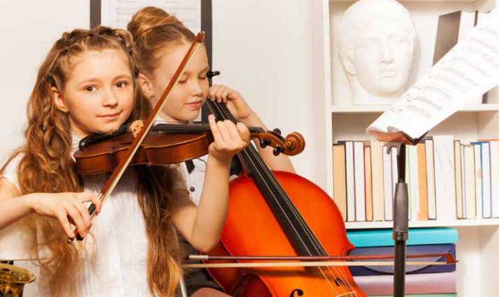
Die Streicherklasse ist ...