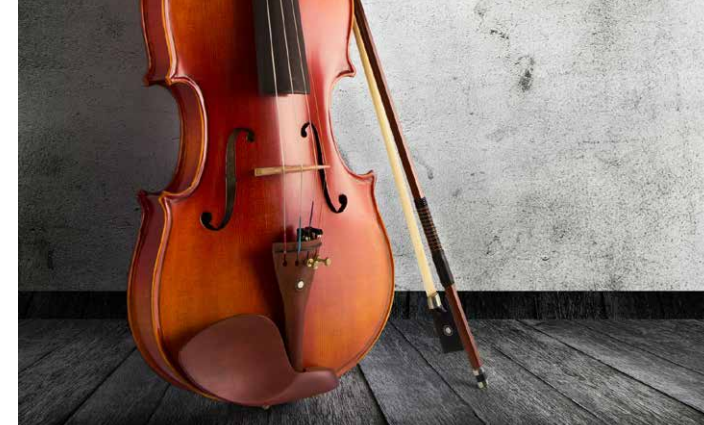
Gemeinsam ist man stark!